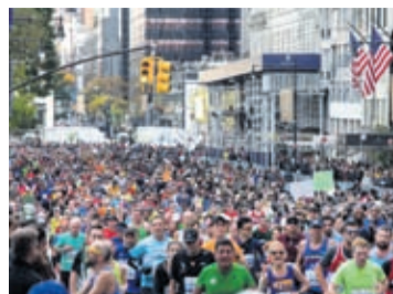
(AP) — Marathon di New York City, e marathon mas grandi di mundo, a keda

cancela ayera pa pandemia di coronavirus, cu organisadonan y oficialnan di e ciudad tumando decision cu tene e careda dia 1 di november lo ta demasiado riesgoso.